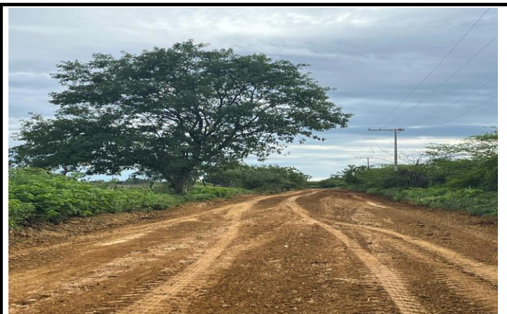
FOTO 07 - EXECUÇÃO DE SERVIÇOS DE ADEQUAÇÃO DE ESTRADAS VICINAIS NO MUNICÍPIO DE ITAGUAÇU/BA