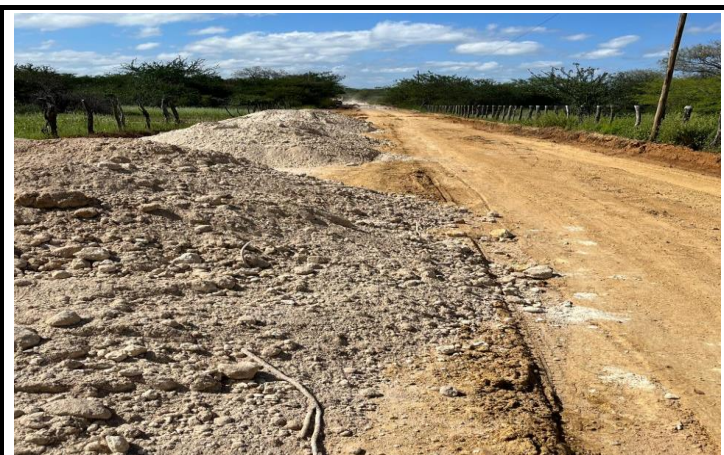
FOTO 11 - EXECUÇÃO DE SERVIÇOS DE ADEQUAÇÃO DE ESTRADAS VICINAIS NO MUNICÍPIO DE ITAGUAÇU/BA