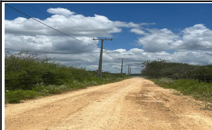
FOTO 10 - EXECUÇÃO DE SERVIÇOS DE ADEQUAÇÃO DE ESTRADAS VICINAIS NO MUNICÍPIO DE ITAGUAÇU/BA