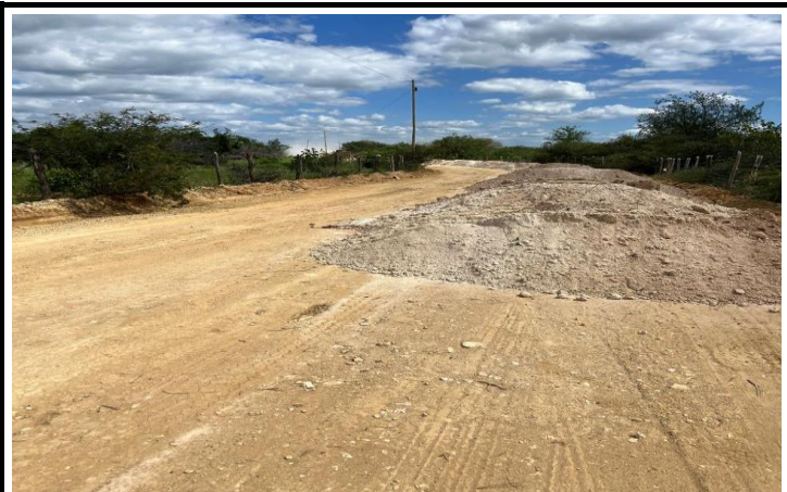
FOTO 09 - EXECUÇÃO DE SERVIÇOS DE ADEQUAÇÃO DE ESTRADAS VICINAIS NO MUNICÍPIO DE ITAGUAÇU/BA