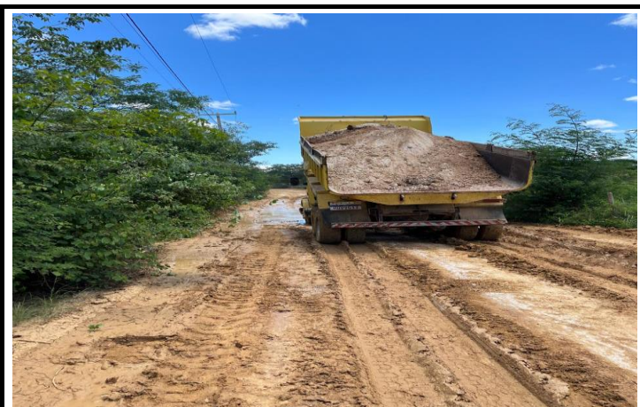
FOTO 05 - EXECUÇÃO DE SERVIÇOS DE ADEQUAÇÃO DE ESTRADAS VICINAIS NO MUNICÍPIO DE ITAGUAÇU/BA