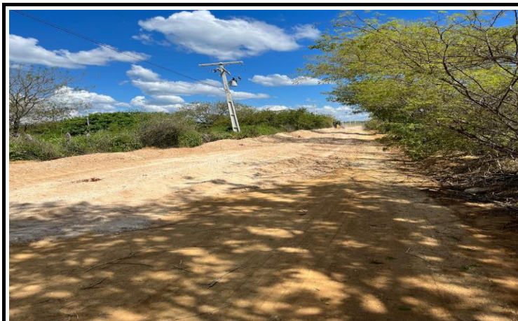
FOTO 02 - EXECUÇÃO DE SERVIÇOS DE ADEQUAÇÃO DE ESTRADAS VICINAIS NO MUNICÍPIO DE ITAGUAÇU/BA