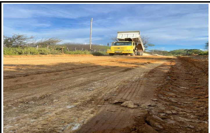
FOTO 01 - EXECUÇÃO DE SERVIÇOS DE ADEQUAÇÃO DE ESTRADAS VICINAIS NO MUNICÍPIO DE ITAGUAÇU/BA