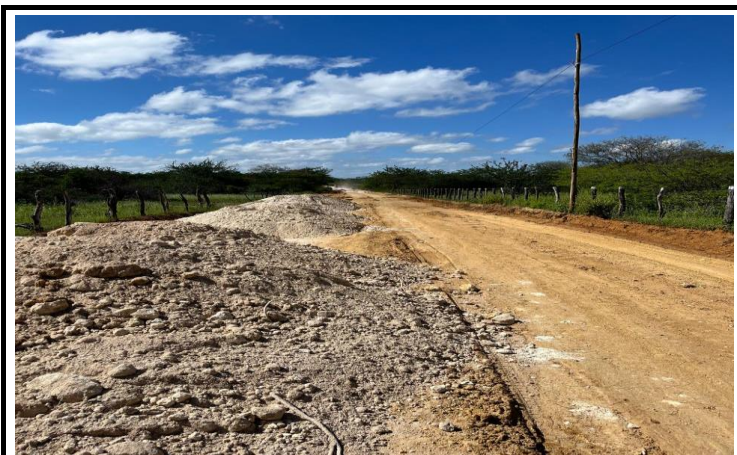
FOTO 12 - EXECUÇÃO DE SERVIÇOS DE ADEQUAÇÃO DE ESTRADAS VICINAIS NO MUNICÍPIO DE ITAGUAÇU/BA