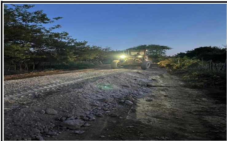
FOTO 04 - EXECUÇÃO DE SERVIÇOS DE ADEQUAÇÃO DE ESTRADAS VICINAIS NO MUNICÍPIO DE ITAGUAÇU/BA