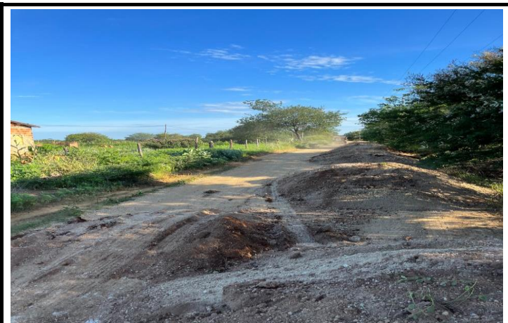
FOTO 03 - EXECUÇÃO DE SERVIÇOS DE ADEQUAÇÃO DE ESTRADAS VICINAIS NO MUNICÍPIO DE ITAGUAÇU/BA