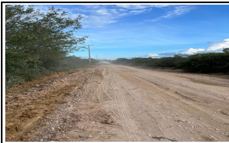
FOTO 06 - EXECUÇÃO DE SERVIÇOS DE ADEQUAÇÃO DE ESTRADAS VICINAIS NO MUNICÍPIO DE ITAGUAÇU/BA